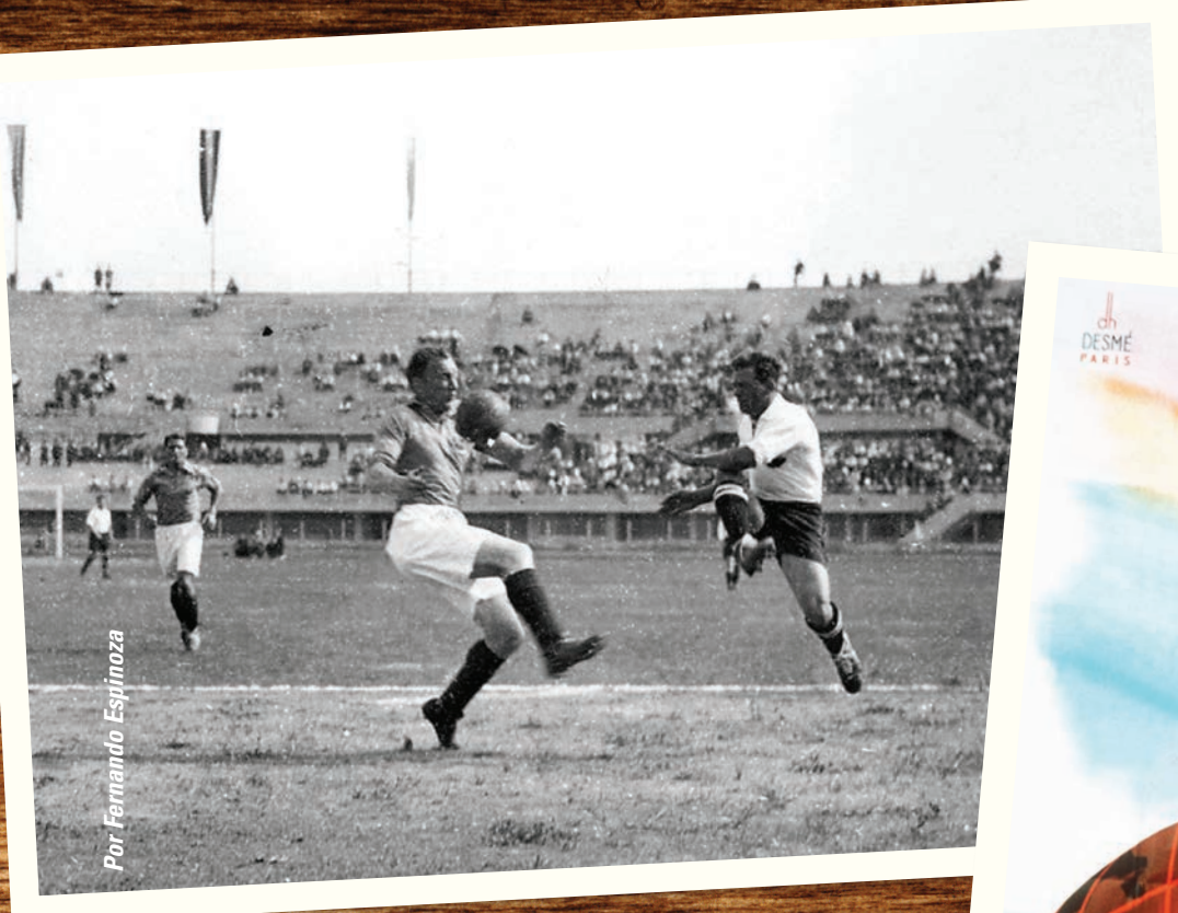
Por Fernando Espinoza